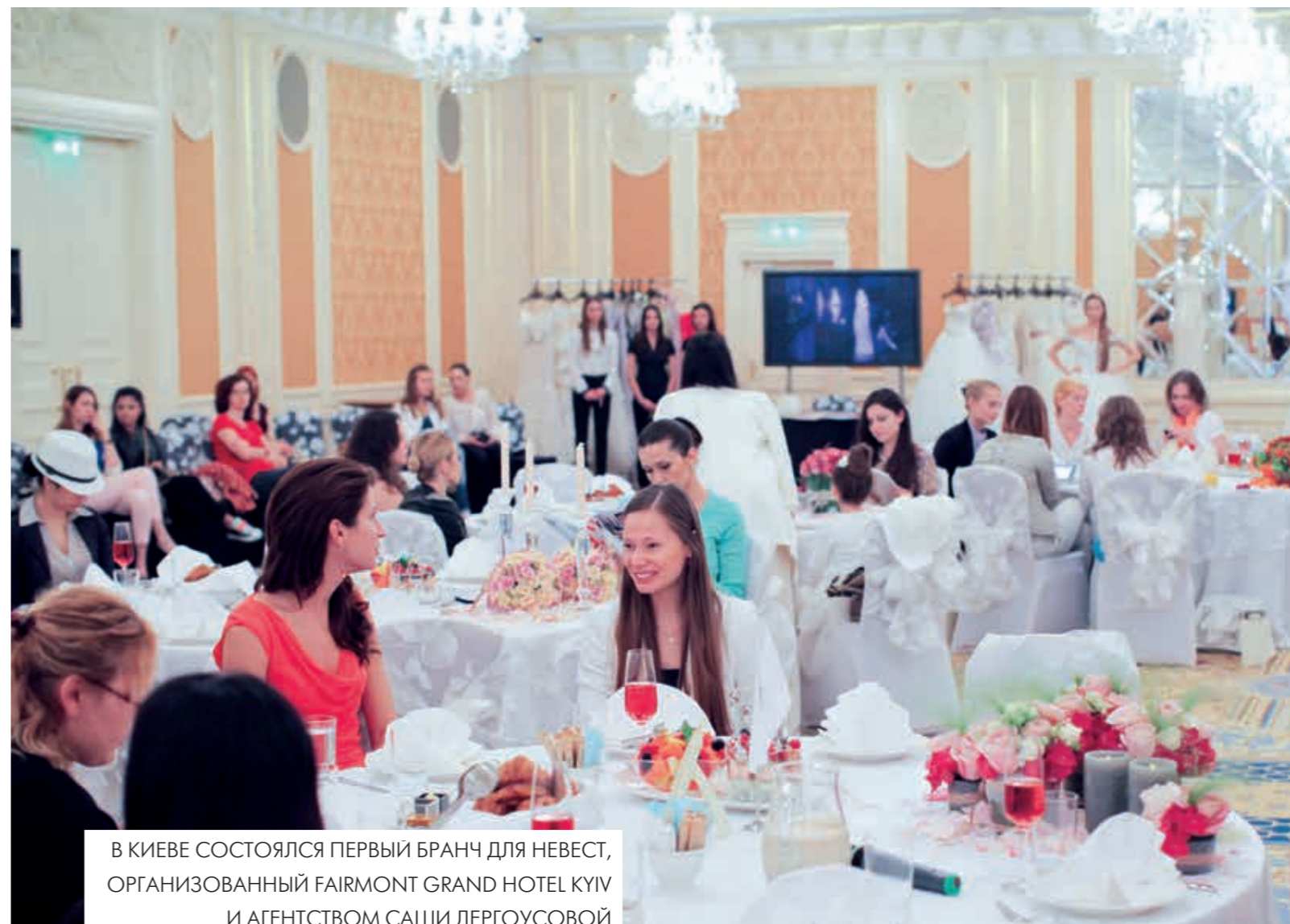
В КИЕВЕ СОСТОЯЛСЯ ПЕРВЫЙ БРАНЧ ДЛЯ НЕВЕСТ, ОРГАНИЗОВАННЫЙ FAIRMONT GRAND HOTEL KYIV И АГЕНТСТВОМ САШИ ДЕРГОУСОВОЙ