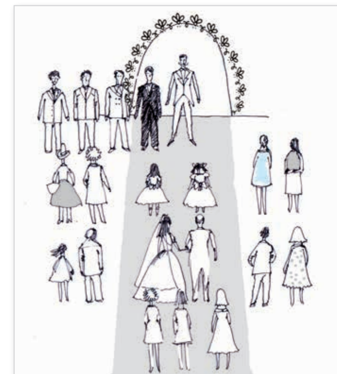
Отец ведет невесту к арке, перед ними flower girls, замыкают шествие подружки невесты, которые двигаются одной линией.

Решающая роль отводится тому, кто проводит свадебную церемонию. Этот человек должен уметь подыскивать нужные слова, завоевывать внимание равнодушных зрителей, быстро реагировать на нештатные ситуации и владеть собой. По моему глубокому убеждению, хороший церемониймейстер обязательно искренний, душевный, красивый... И