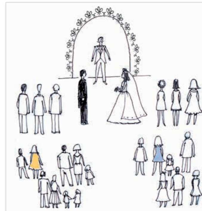
Размещение у арки. Свидетели выстраиваются со стороны жениха, подружки - со стороны невесты