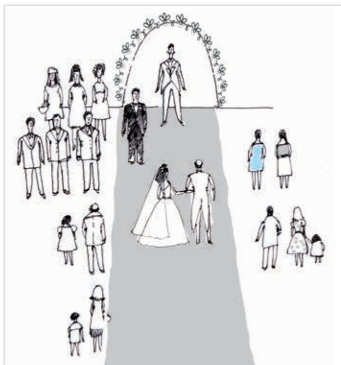
Отец ведет невесту к арке. Жених, свидетели и подружки уже ожидают ее. За невестой могут идти дети, несущие шлейф или разбрасывающие лепестки роз.