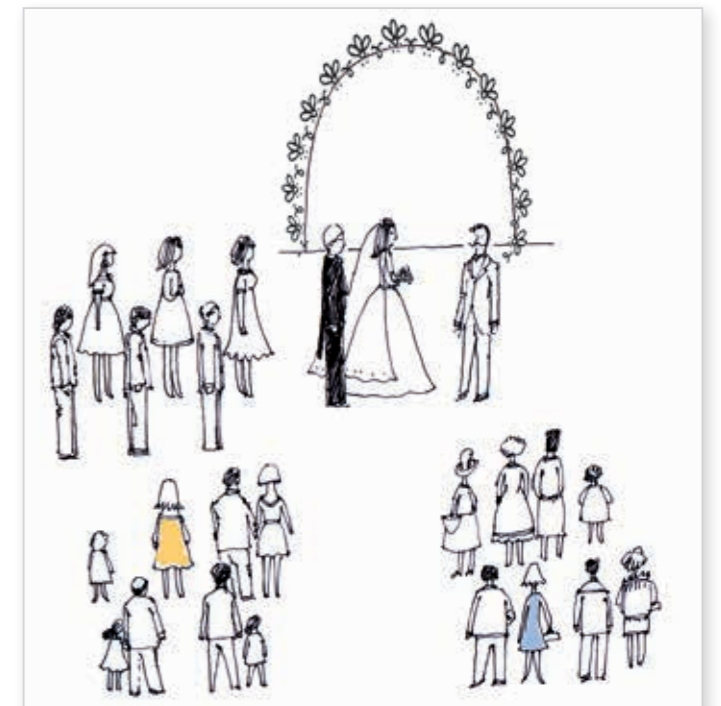
Свидетели и подружки невесты парами стоят позади молодоженов