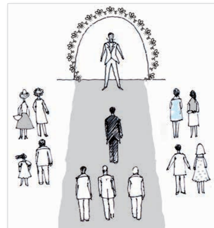
Подходим к арке. Церемониймейстер в центре. За женихом идут свидетели. Гости стоят или сидят по обеим сторонам прохода.